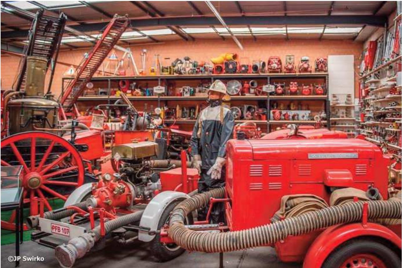
So sah es einst in Aalst aus

darin stand genau so nass als wenn sie draußen gestanden hätten. Auch bekam man relativ oft ungewünschten Besuch. Kupferdiebstähle kamen mehrmals vor und unerwünschte Besucher machten sich an die Fahrzeuge ran um zu Plündern oder Filme zu machen. Sogar die Steuerräder aus den Fahrzeugen wurden gestohlen.