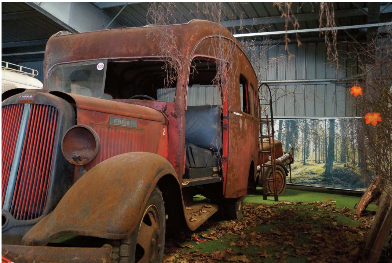
Es gibt Fahrzeuge die man aufbewahren möchte, sogar in diesem Zustand

Bald wurde deutlich, dass es keine gute Idee war alles auf zu bewahren. Vor allem die Fahrzeuge nahmen viel Raum ein. Deshalb wurde in einer Arbeitsgruppe (mit Fahrzeugexperten) vereinbart, dass nur Fahrzeuge aufbewahrt werden sollten, die folgende Kriterien beinhalteten: sie