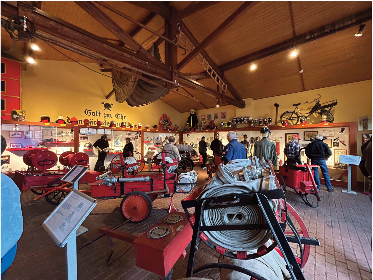
Besuch des Feuerwehrmuseums Dietzenbach.

seinem Bericht über die Sitzung des Beirats. Dabei ging er insbesondere auf das von ihm und Thomas Reichel, Regionalgruppensprecher Süd, erstellte Diskussionspapier zur möglichen Neuausrichtung und Zukunft des DFV-AK Feuerwehrmuseen ein. Kernpunkte sind dabei die mögliche Aufgabe der bisherigen Regionalgruppen zugunsten einer Eingliederung in die Strukturen der jeweiligen Landesfeuerwehrverbände sowie die Neustrukturierung in Form von länderübergreifenden Facharbeitsausschüssen. Entsprechende Entscheidungen werden zu einem späteren Zeitpunkt getroffen.