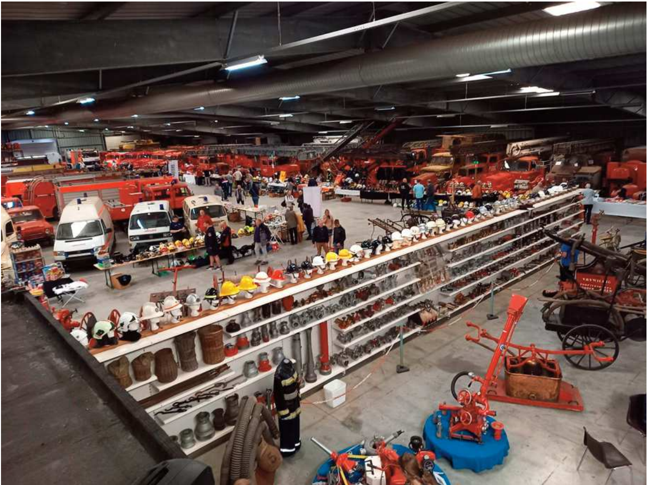
Eine Feuerwehbörse in Weelde

Mann das Geld (teils) zurückzahlen. Zum Zweiten wurde dann ein (mit Geld vom Ministerium) Kultur- und Erbgut Zentrum in Flandern in die Hand genommen. Das musste beurteilen, welche Teile der Sammlung ausgestellt werden sollten und welche entweder im Depot oder zum Verkauf angeboten werden sollten. Die betreffende Mitarbeiterin startete mit viel Enthusiasmus, doch als diese in Mutterschaftsurlaub ging, war kein Ersatz durch eine andere Mitarbeiter(in) verfügbar.