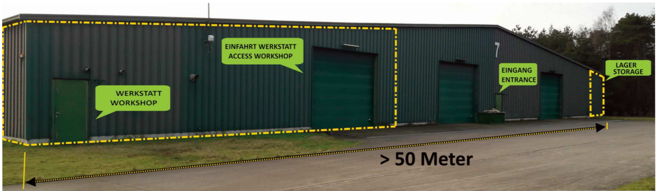
Museum in Weelde (oben und unten)

mussten in Belgien bei Feuerwehren gedient haben. Einige sind z.B. zurückgegeben worden an die Feuerwehren in den Niederlanden und von einigen ist sogar die Restaurierung nun im Gange.