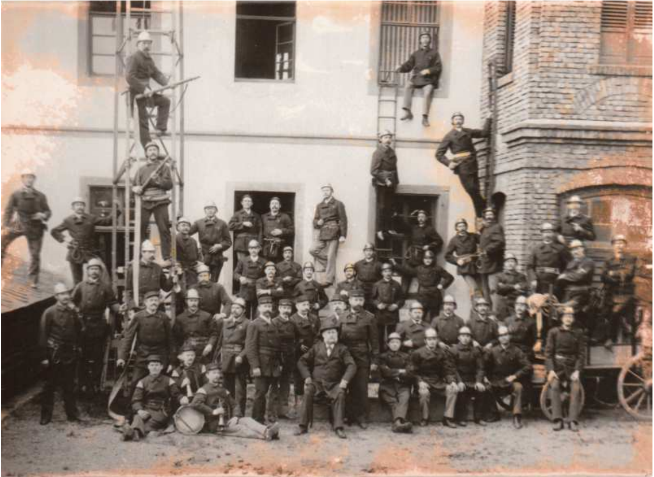
Die Freiwillige Feuerwehr Niederlahnstein 1903

der Binnenschifffahrt, Obstanbau (bekanntes Erdbeeranbaugebiet), einer Draht- und Chammottefabrik.