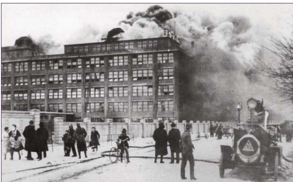
Abb. 3: Brand in der Schokoladenfabrik von Sarotti

Dies veranlasst die Firma Sarotti die Stadt Berlin auf Schadensersatz zu verklagen, weil ihrer Ansicht nach die Kakaobohnen noch zu retten gewesen wären und es zu Versäumnissen bei der Feuerwehr gekommen wäre. Erst 1929 ver-