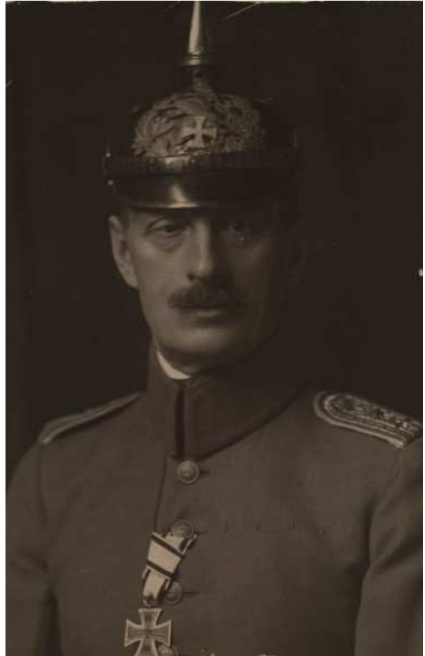
BD Hans Stahl als Militärbranddirektor in Mainz 1914

salien der französisch-belgischen Besatzungsbehörden nicht zurecht, jedenfalls beantragte er seine Versetzung in den Ruhestand die ihm 1920 gewährt wurde. Es folgten Beratertätigkeiten in Bayern, Baden, Württemberg und in der Schweiz sowie verschiedene Publikationen. Er starb unerwartet im Alter von 71 Jahren am 9. September 1939 an den Folgen eines Herzschlages.