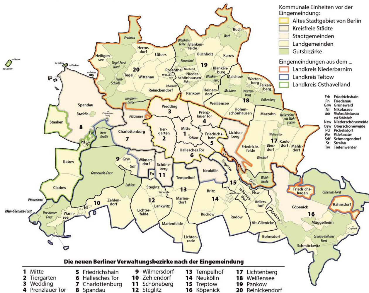
Abb. 1:

(besonders kleinflächige Gutsbezirke und Forstgebiete wurden nicht in die Darstellung aufgenommen)