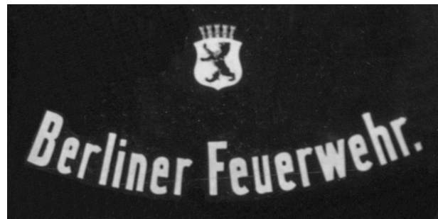
Abb. 2: Türbeschriftung auf einem Fahrzeug 1921

Mit dem neuen Haushaltsjahr treten am 1. April 1921 die „Bedingungen für die Übernahme der Feuerwehr“ in Kraft. Damit ist die Berliner Feuerwehr eine städtische Behörde, sie führt den Schriftwechsel abweichend unter „Magistrat von Groß-Berlin, Feuerwehr“.