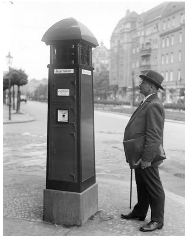
Abb. 6: Einheitsfeuermelder von Siemens

Durch die Neuorganisation kommt es einerseits zu weiteren Auflösungen von Freiwilligen Feuerwehren (Britz, Lichterfelde, Niederschöneweide, Stralau, Treptow und Zehlendorf), andererseits werden ab 1920 aber auch die neuen Wehren Köpenick-Nord, Falkenberg, Hellersdorf, Lübars, Müggelheim, Schwanenwerder, Wartenberg und Wilhelmsruh gegründet. Auch erste Wachneubauten für die Berufszüge werden ab 1925 in Dienst genommen, so in Steglitz