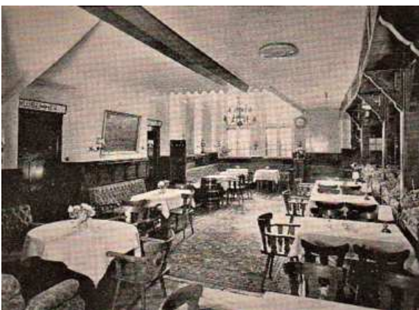
Der Gasträum der Krone vor dem Feuer

Später findet man im Gebäude drei Brandherde