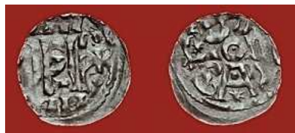
Vorder- und Rückseite einer der Münzen des Bardowicker Münzschatzes

Inzwischen hat sich herausgestellt, dass in der Nacht des 29. Dezember auch ein Einbruch im Museum für das Fürstentum Lüneburg stattgefunden hatte. Dabei wurden wertvolle Münzen [3] und einige alte Schmuckstücke gestohlen. Das Legen eines Feuers wurde nur verhindert, weil der Hausmeister durch Lärm wach geworden war und die Räume kontrolliert hat. Dadurch wurde der Einbrecher offensichtlich gestört und ist geflohen. Der Diebstahl des Münzschatzes wurde allerdings erst im Laufe des nächsten Vormittags entdeckt und bekannt ge-