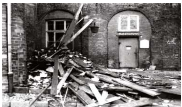
Brandschuttberg vor dem damaligen Eingang der Bücherei

durch Löschwasser als durch das Feuer. Die dabei entstandenen Schäden an den Büchern sind auch bis heute (2020) nach 60 Jahren