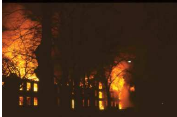
Das alte Kaufhaus in Vollbrand – 22. Dezember 1959 - Blick von der Reichenbachstraße gegen 22.15 Uhr

Das alte Kaufhaus brennt trotz des umfangreichen Feuerwehr-Einsatzes total aus. Nur die Barockfassade des südlichen Giebels kann, wenn auch beschädigt, erhalten werden [2]. Aus den, im vorderen Bereich befindlichen Räumen des Goldschmieds, eines Kunstmalers und aus dem Ostpreussischen Jagdmuseum können nur wenige Sachwerte und Exponate geborgen