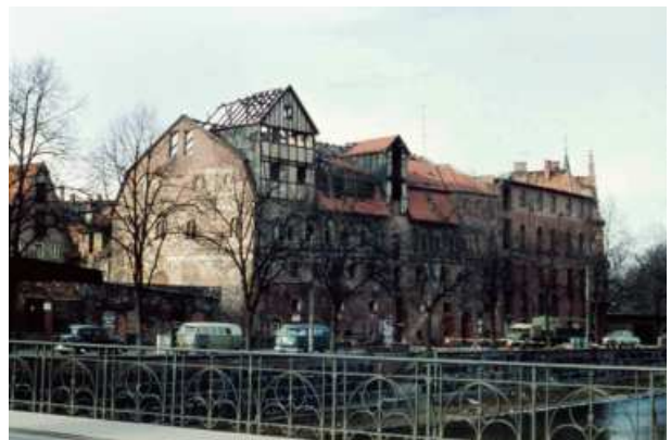
Der Viskuhlenhof nach dem Brand - nur der Dachstuhl und die oberste Etage sind in Mitleidenschaft gezogen

Funkenflug ebenfalls Feuer gefangen hatte. Es handelt sich hierbei um einen alten Salzspeicher, der inzwischen auch zum Teil als Lagerhaus genutzt wird und in dem auch einige Firmen sowie ein großer Kornspeicher untergebracht sind. Doch diesmal gewinnt die Feuerwehr den Wettlauf mit dem Feuer, das Gebäude wird vor der völligen Vernichtung bewahrt.