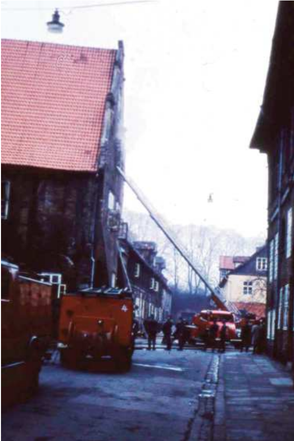
Feuer Ratsbücherei - Nachlöscharbeiten. Im Foto vorn zwei LF 15. Das vordere noch in Tannengrün, das andere dahinter schon wieder neu rot lackiert.

noch immer nicht vollständig behoben. Es werden immer noch alte Bücher nach und nach restauriert. Das Feuer in der Ratsbücherei wurde auch nach einem Einbruch gelegt. Jetzt wird man in der Stadt und bei der Kriminalpolizei langsam nervös, da sich inzwischen herausgestellt hat, dass dies die sechste Brandstiftung nach einem Einbruch war.