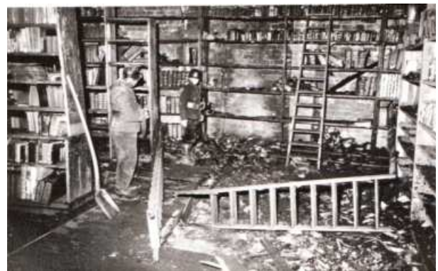
Teil der ausgebrannten Ratsbücherei