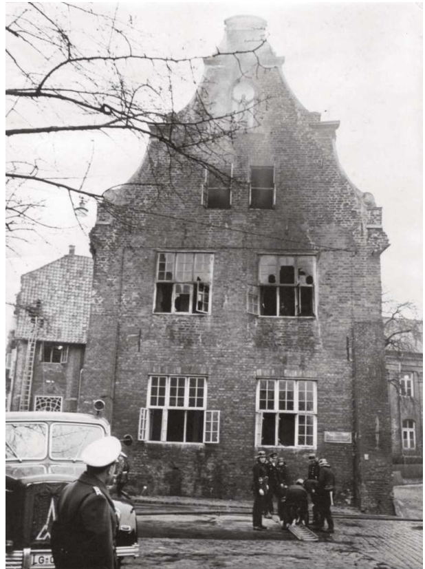
Blick auf die Fassade der Ratsbücherei am Mittag danach. Links das Tanklöschfahrzeug von 1951.

Bei dem Brand in der Ratsbücherei fallen unersetzliche Kulturgüter dem Feuer zum Opfer. Obwohl die Feuerwehr zusammen mit dem Bundesgrenzschutz versucht zu retten, was zu retten ist, verbrennen viele wertvolle Bücher oder werden durch den Brand und Löschwasser stark beschädigt. Von den 49.905 Büchern, darunter 27.393 Bände sehr alter Literatur, sind 9.040 Bücher total verbrannt. Dabei handelte es sich vorwiegend um Bände aus dem 16. bis 18. Jahrhundert, zum Teil seltenem theologischem Erstdruck aus der Reformationszeit. 18.353 Bücher sind mehr oder weniger stark beschädigt, leider, wie sich später herausstellt, mehr noch