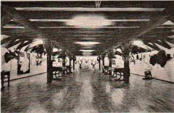
Blick in das Ostpreussische Jagdmuseum im Dachgeschoss

Das Gebäude steht beim Eintreffen des Wehrführers auf der ganzen Länge schon in Vollbrand. Sofort wird zusätzlich Großalarm mit den Sirenen für die Lüneburger Feuerwehr ausgelöst. Später eilen auch verschiedene Feuerwehren aus dem Kreisgebiet sowie aus dem Kreis Harburg zu Hilfe. Auch ein Zug der Hamburger Berufsfeuerwehr erscheint spät in der Nacht an der Einsatzstelle. Doch die ganze Hilfe ist umsonst, denn das Gebäude ist nicht zu retten. Die Feuerwehr muss sich in der Hauptsache darauf beschränken, die in der engen Kaufhausstraße gegenüber liegenden Häuser vor dem Übergreifen der Flammen zu schützen