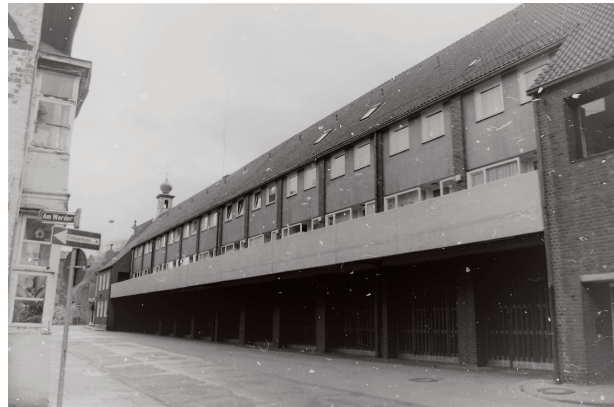
Das Feuerwehrhaus im ehemaligen „Alten Kaufhaus“ in der Kaufhausstraße. (1966 bis 2007)

Im September 1966 wurde das 1959 abgebrannte „Alte Kaufhaus“, nach zwei Jahren Bauzeit, als neues Feuerwehrhaus an die Freiwillige Feuerwehr Lüneburg übergeben. Es war zu dem Zeitpunkt das modernste Feuerwehrhaus in Norddeutschland mit 12 Fahrzeugboxen und darüber befindlichen zwölf Wohnungen