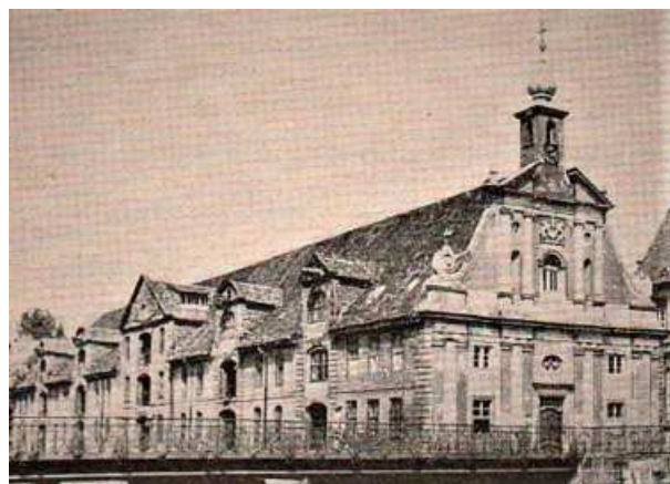
Das Alte Kaufhaus vor seiner Vernichtung

Auch befinden sich im, durch eine Wand abgetrennten Giebelbereich, einige Räume, in denen ein Kunstmaler und ein Goldschmied eine Heimstatt gefunden haben. Außerdem findet man im vorderen Dachgeschoss des Gebäudes das vor kurzem neu gegründete ostpreußische Jagdmuseum [1].