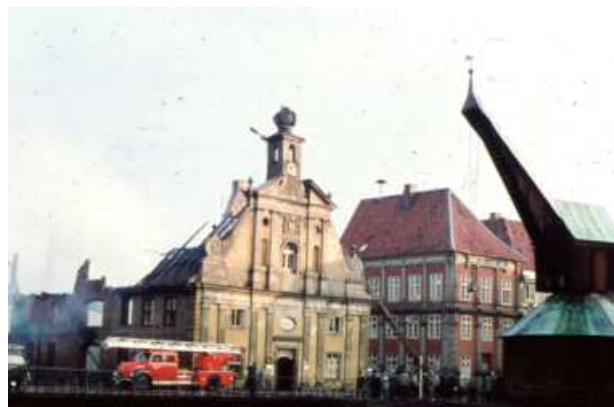
Das ausgebrannte Alte Kaufhaus am Morgen danach mit der noch erhaltenen Barockfassade. Im Vordergrund die DL 30h von 1958, rechts an der Gebäudeecke die DL 20 von 1930.

In ersten Presseberichten wird über viele Ursachen spekuliert. Es ist aber noch nichts genaues über den Grund des Brandausbruchs bekannt. Der Schaden durch den Brand ist nach ersten Schätzungen in Geld nicht auszudrücken, weil viele ausgelagerte Stücke des Lüneburger Museums und anderer Sammlungen sowie sehr viele andere Sachen, u. a. auch vom Theater Lüneburg, verbrannt sind. Diese waren in dem Lagerhaus gelagert worden, da es in den ursprünglichen Häusern an Platz dafür fehlte. Dadurch sind auch einige unwiederbringliche Kunstwerke und Exponate aus der Frühzeit Lüneburgs vernichtet worden. Vom Theater sind Kulissen der laufenden Spielzeit sowie auch ältere komplett verbrannt. Dadurch war das Theater gezwungen, in der laufenden Spielzeit nun zu improvisieren.