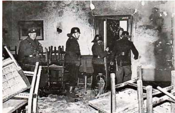
Der ausgebrannte Gasträum des Restaurants 'Zur Krone' (oben und unten)

und stellt fest, dass wiederum dort ebenfalls auch ein Einbruch erfolgt war. Brandsachverständige des Landeskriminalamtes aus Hannover sichern diesmal viele Spuren. Bei der Kripo herrscht die Meinung vor, dass es sich um einen sehr ortskundigen, intelligenten und skrupellosen Verbrecher handelt, der Lüneburg hasst. Es wird vom Regierungspräsidenten für Hinweise, die zur Ergreifung des Täters führen, eine Belohnung von 5.000 DM ausgesetzt. Von verschiedenen Privatpersonen wird die Belohnung auf insgesamt 13.000 DM erhöht.