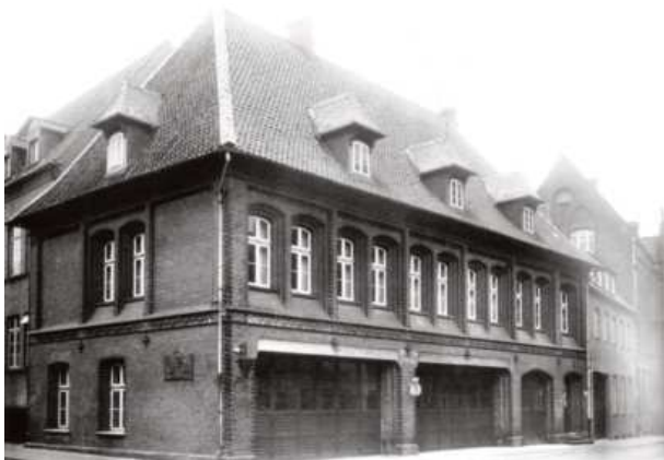
Das Gerätehaus in der Katzenstraße 1a (1888 – 1966)

neueren Fahrzeugen: eine Drehleiter DL 20, Baujahr 1930 (noch mit Holzleiterpark); ein Löschgruppenfahrzeug LF 8 von 1938; zwei Löschgruppenfahrzeuge LF 15 von 1942; eine Drehleiter DL 22 von 1944; ein Tanklöschfahrzeug (TLF) 15/50 Magirus von 1951; ein TLF 15/35 Magirus von 1955 und eine Drehleiter DL 30h von 1958. Zwei Fahrzeuge, die beiden Tanklöschfahrzeuge (TLF), waren seit Juni 1959 mit UKW-Funk ausgerüstet. Dieser lief über den Polizeifunk, da die Feuerwehr noch keine eigene Frequenz, geschweige denn Sende- und Empfangsmöglichkeiten im Gerätehaus hatte.