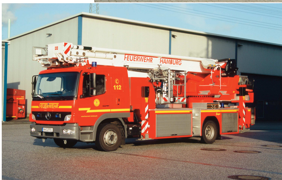
Erstmals wurden 2006 drei Teleskopmastfahrzeuge TMF 23-12 von Bronto-Skylift beschafft. Fahrgestell: Mercedes Atego 1628 F.