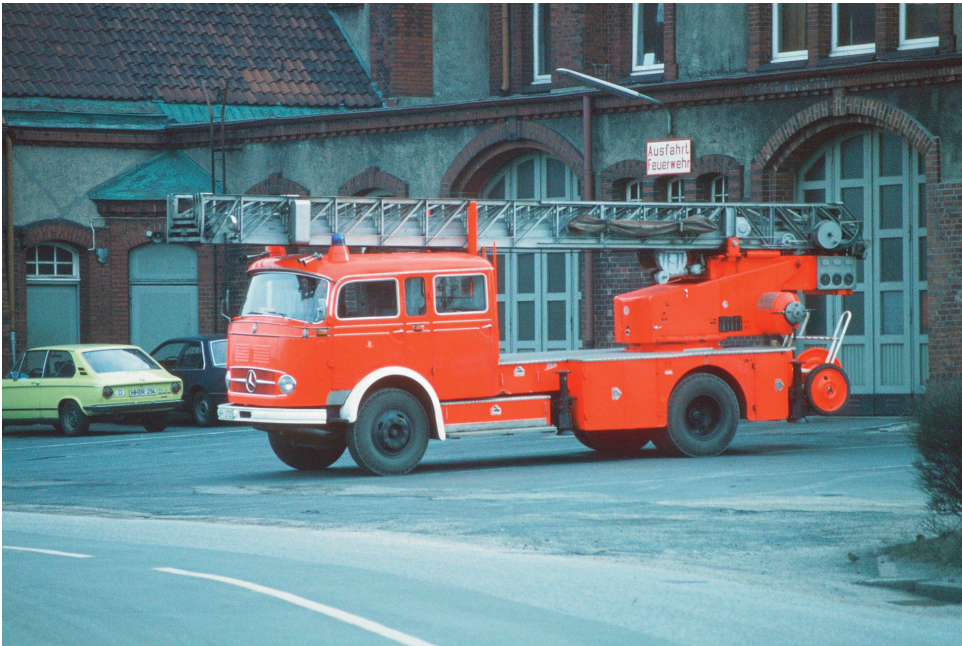
Metz-DL 30 h (h=hydraulisch) auf "Pullman"-Fahrgestell Mercedes-Benz LP 329. 1958 wurde die erste Drehleiter der Nachkriegszeit beschafft. Bis 1965 wurden insgesamt 18 Stück angeschafft. Besonderes Merkmal: 3-t-Kraneinrichtung.

lich: eine DL 30 von Metz auf Mercedes-Benz-Fahrgestell LKO 325.