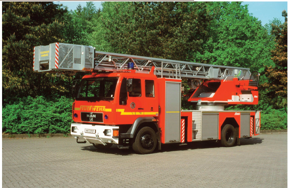
1997 erfolgte ein Fahrgestellwechsel von Mercedes zu MAN. Bis 1999 wurden insgesamt fünf Metz-Drehleitern auf MAN 15.264 LC bzw. 15.285 LC mit langer Kabine aufgebaut.