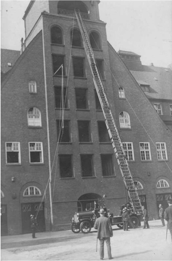
Dieselbe Magirus-DL 25+2 ausgezogen am Steigerturm der Feuerwache Berliner Tor.

ten. Der frühere Oberbranddirektor Hans Brunswig berichtet von einem besonders krasen Fall: