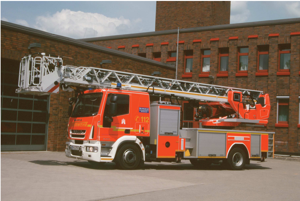
Nachdem 1996 erstmals seit den 1940er-Jahren eine Magirus-Drehleiter DLK 23-12 beschafft worden war, wurde 2009 ein Großauftrag über vier Magirus DLK 23-12 CC Vario erteilt. Fahrgestell: Iveco Magirus 160 E 30.