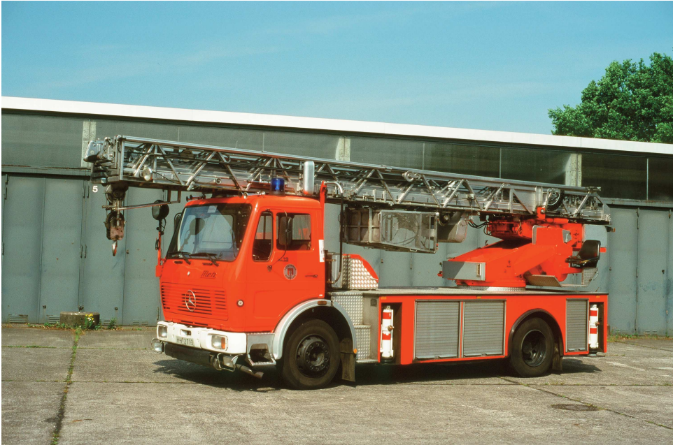
Eine der DLK 23-12 von Metz auf dem Frontlenker-Fahrgestell der "Neuen Generation" Mercedes-Benz 1419 F. Von diesem Typ wurden von 1977 bis 1987 18 Stück beschafft.

leistung von bisher 192 PS (141 kW) erhöhte sich damit auf 216 PS (159 kW). Von 1977 bis 1990 wurden insgesamt 20 DLK 23-12 von der Firma Metz beschafft. Die DLK 23-12 aus dem Beschaffungsjahr 1990 war die erste, die über einen fest angebrachten Klappkorb verfügte. Der Leiterpark konnte bis zu 17 Grad unter Niveau abgesenkt werden.