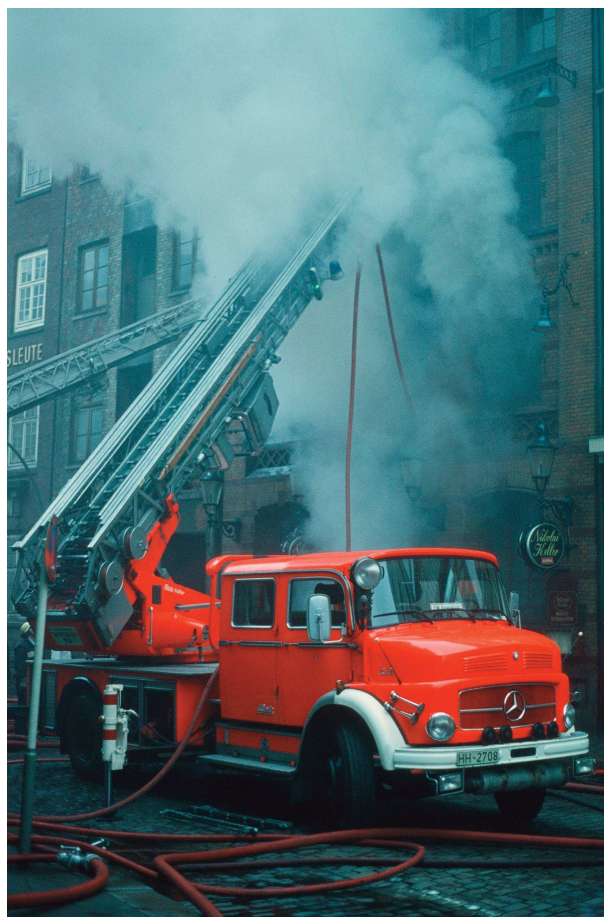
Metz-DL 30 auf Kurzhauber-Fahrgestell Mercedes-Benz L 1519. Von 1972 bis 1976 wurden insgesamt 4 Stück beschafft.

In der Zeit von 1972 bis 1976 standen lediglich