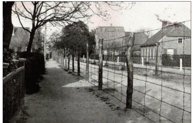
Auch für die Feuerwehr kein Durchkommen: Grenzsicherung durch Stacheldraht am Hellweg von 1945-1949