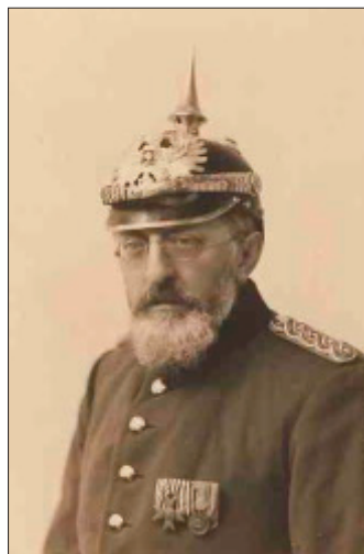
Kreisbrandmeister Rudolf Fischer

Die Freiwillige Feuerwehr Suderwick wurde am 29. Mai 1911 auf Initiative des damaligen Kreisbrandmeisters Rudolf Fischer (späterer Ehrenbürger der Stadt Bocholt) gegründet, nachdem es innerhalb eines Monats drei Großbrände in Suderwick bzw. Dinxperlo mit Personen- und erheblichem Sachschaden gegeben hatte. Bis zu diesem Zeitpunkt existierte in beiden Orten lediglich eine Pflichtfeuerwehr, der alle Männer zwischen 18 und 45 Jahren zwangsweise angehörten. Da man