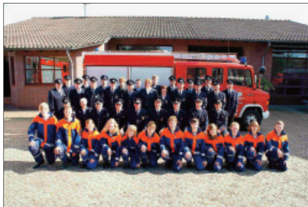
Gruppenbild 2011