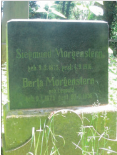
Abb. 3. Grabstein des Wehrmannes Siegmund Morgenstern auf dem Judenfriedhof in Gangelt

Während des Ersten Weltkrieges verstarb am 04.09.1916 der G a n g e l t e r We h r m a n n Siegmund Morgenstern. Er wurde auf dem jüdischen Friedhof in Gangelt beigesetzt. Auch sein Grabstein ist bis heute gut erhalten.