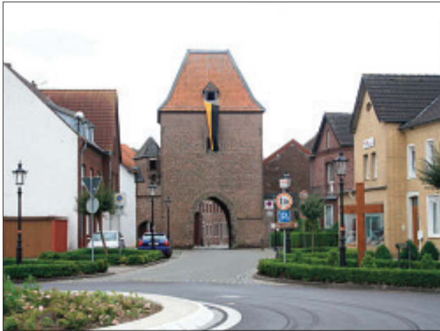
Abb. 5. Das Heinsberger Tor in Gangelt

Aufgrund der Boykottmaßnahmen musste Emil