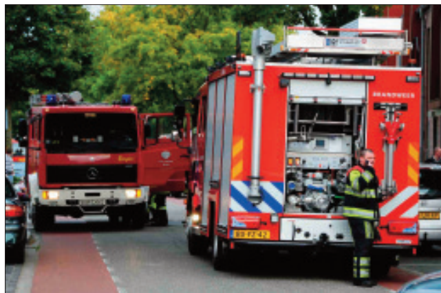
Gemeinsamer Einsatz mit der Brandweer Dinxperlo am Altenheim Bültenhaus

Am 16. Januar 2009 fand mit der Einweihung des Wohn- und Pflegehauses „Bültenhaus“ das sogenannte „Europaprojekt“ seine Vollendung. Die Besonderheit dieses Projektes besteht darin, dass das niederländische Careaz Dr. Jenny Woonzorg-centrum und das vom deutschen evangelischen Johanneswerk in Suderwick gebaute Wohn- und Pflegehaus „Bültenhaus“ durch eine gläserne