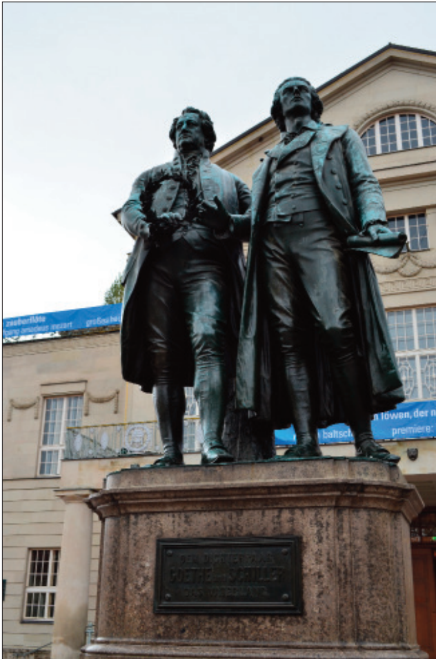
Goethe und Schiller

ich meinen Platz verlassen, weil allenfalls nur wenige Augenblicke auszuhalten war. Meine Augenbrauen sind versengt, und das Wasser in meinen Schuhen siedend hat mir die Zehen bebrüht, ein wenig zu ruhen legt ich mich nach Mitternacht, da alles noch brannte und knisterte im Wirthshaus aufs Bett, und ward von Wanzen heimgesucht und versuchte also mach menschlich Elend und Unbequemlichkeit. Der Herzog und der Prinz kamen später, thaten das ihrige. Einige ganz gewöhnliche immer unerkannte Fehler bey solchen Gelegenheiten hab ich bemerckt. Verzeihen Sie dass ich mit Bildern und Gestalten des Gräuels Sie in Ihre Freuden verfolge. Es fiel mir in der Nacht und denen Flammen ein, wie das Schicksal wüthend und nun Sicilien wieder bebt und die Berge speyen, und die Engländer ihre eigene Stadt anzünden und das alles im aufgeklärten 18ten Jahrhundert.“