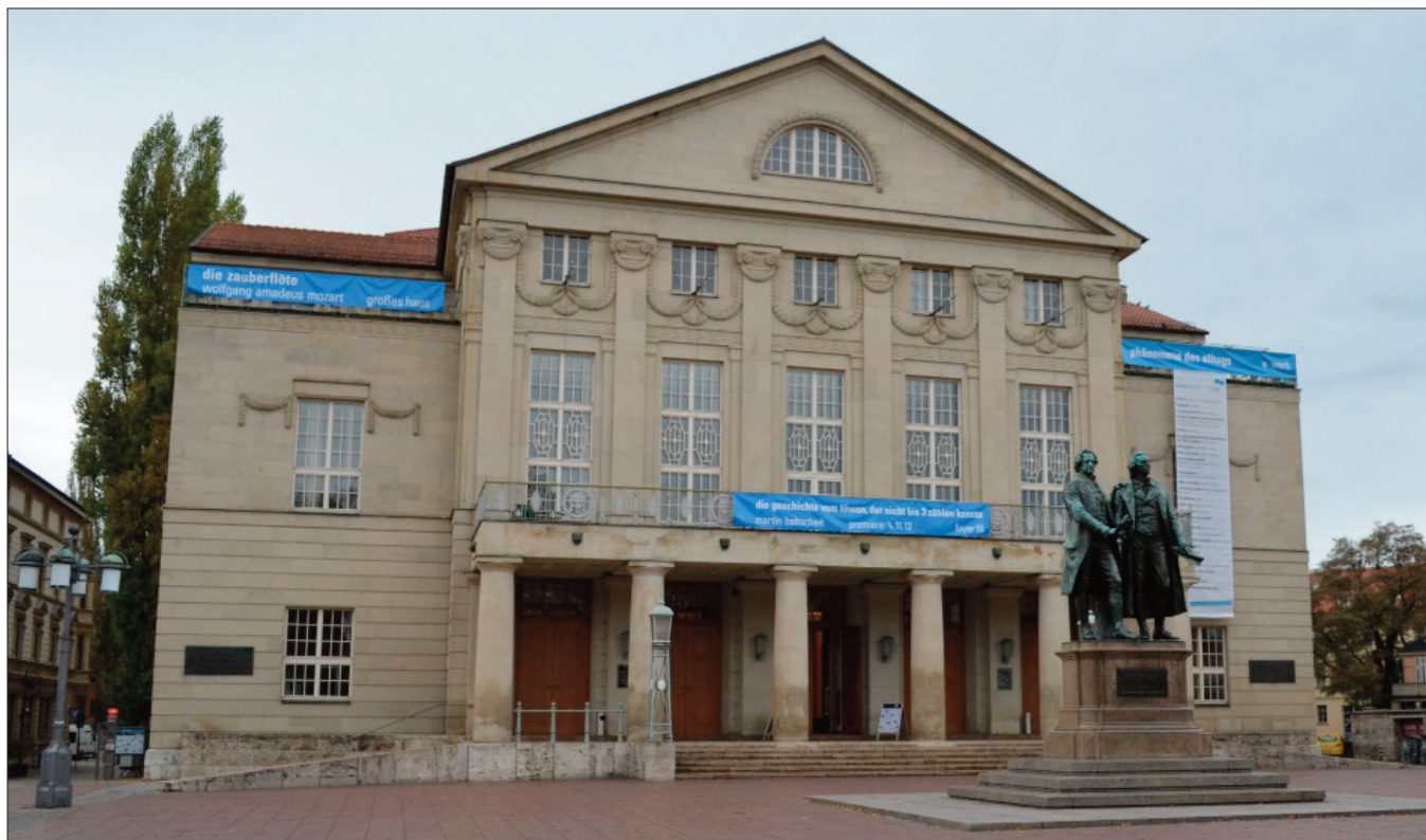
Denkmal von Goethe und Schiller vor dem Gebäude in dem die Weimarer Verfassung verabschiedet wurde

Anlässlich dieses Brandes ist in der Ilmenauer Gegend ein Postwagen ausgeraubt worden und Goethe hat dann gleich anschließend mit den Husaren die Verfolgung des Räubers aufgenommen. Eine Feuersbrunst war es, die Goethe zum ersten Mal