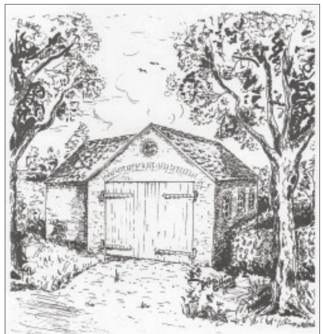
Altes Spritzenhaus (Zeichnung von Dieter Elting, Suderwick)

Obschon die Suderwicker bereits seit 1887 ein eigenes Spritzenhaus, eine Handdruckspritze mit 80 m Schlauch und einem Strahlrohr, 40 Eimern und 2 Wasserwagen mit 500-700 Litern Fassungsvermögen besaßen, war ihre Effektivität minimal. Nach dem Läuten der Brandglocken wurde die Handdruckspritze im Laufschrift zur Einsatzstelle