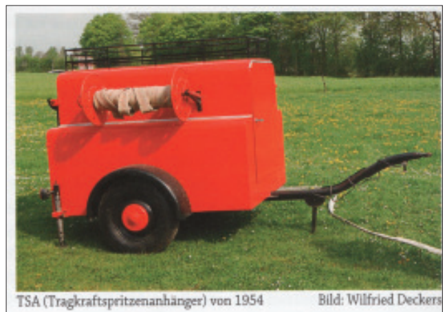
TSA (Tragkraftspritzenanhänger) von 1954