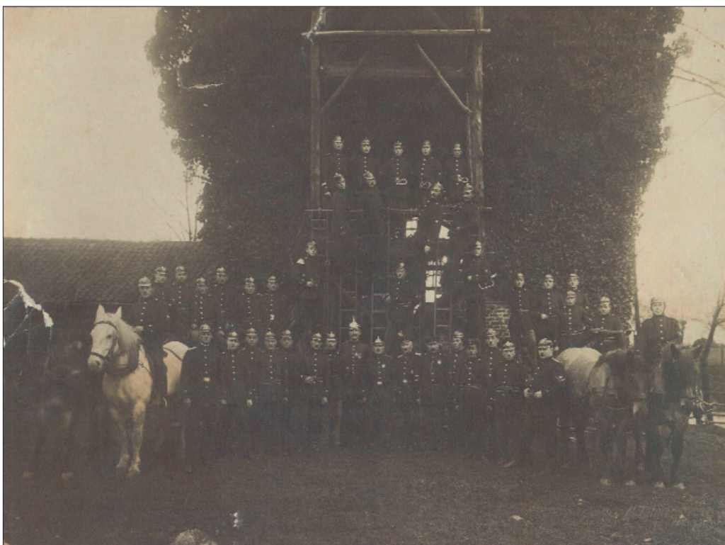
Abb. 4. Gruppenfoto zum 25-jährigen Bestehen