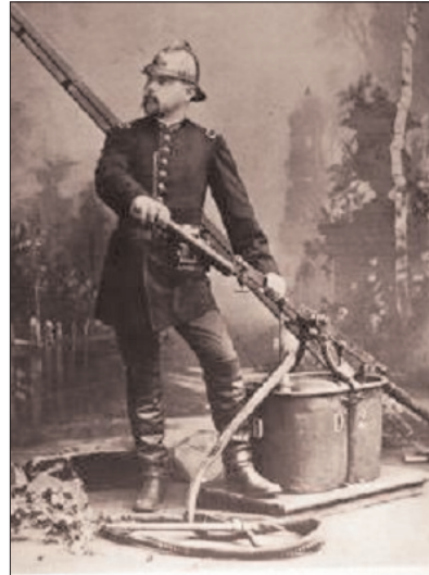
Elsässischer Feuerwehr-Offizier (Oberbrandmeister), 1914

Auch nach dem Anschluss ans Deutsche Reich dauerten diese Verhältnisse noch einige Zeit fort. Im Gegensatz zu den süddeutschen Ländern, deren Feuerwehren eine staatliche Förderung erhielten, wirkten die politischen Spannungen im Grenzland Elsaß-Lothringen hemmend auf deren Entwicklung. Erst die Zeit nach 1880 brachte vermehrt Neugründungen. Unterstützend wirkte der Bau von Wasserrohrnetzen, der planmäßig gefördert wurde. Nicht zuletzt war es auch die Arbeit des Verbandes, der auf Gemeinden ohne organisierte Feuerwehr einwirkte, solche aufzustellen. Stetig stieg die Zahl der Neugründungen. Im Jahr 1909 verfügten im Reichsland immerhin 784 Gemeinden (52%) über eine organisierte Feuerwehr, davon waren 512 Mitglied im Landesfeuerwehrverband (65% der Feuerwehren). Bei den Gemeinden ohne Feuerwehr handelte es sich im Wesentlichen um ländlich geprägte Ortschaften, die kaum 100 Einwohner zählten. Die größten Städte