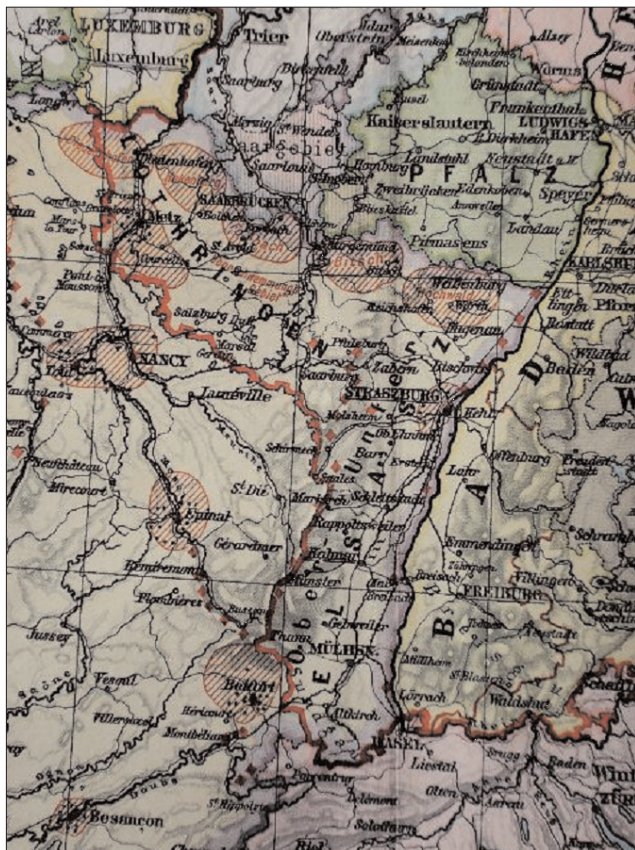
Das Reichsland Elsaß-Lothringen, 1871 - 1918

Das Gebiet gehörte seit Alters her zum Heiligen Römischen Reich. Der größte Teil des späteren Reichslandes wurde von Frankreich unter Ludwig XIV. im Zuge der Reunionspolitik in der zweiten Hälfte des 17. Jahrhunderts nach und nach annektiert. Das Elsaß blieb jedoch kulturell deutsch geprägt. In der französischen Revolutionszeit wurde die Region vollständig ein Teil Frankreichs.