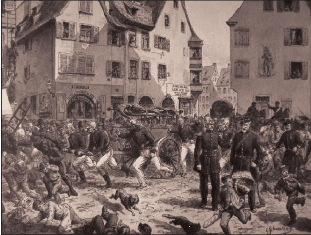
Historischer Löscheinsatz in Straßburg

baren Elsaß-Lothringischen Verdienstabzeichen für Feuerwehrleute, die sich vorwurfsfrei und verdienstvoll im Feuerwehrdienst betätigten, vorhanden, zumal es solche in den meisten anderen deutschen Bundesstaaten bereits gab. Ein 1904 eingereichter Antrag auf Schaffung eines eigenen Feuerwehr-Ehrenzeichens für 25-jährige Dienstzeit in Form einer am Bande zu tragenden Medaille wurde vom Ministerium für Elsaß-Lothringen abgelehnt. Die Hoffnung stieg, nachdem 1908 die