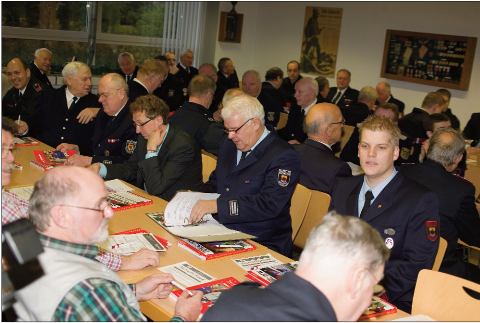
Rund 70 Teilnehmer folgten der Einladung des VdF NRW zum 5. Fachforum „Feuerwegeschichte“.