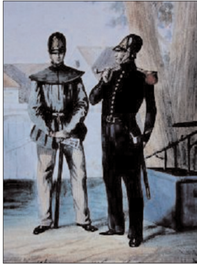
Pompier und Offizier des Straßburger Municipalcorps, 1836

nen musterhaften Aufbau und blieben wegen ihrer Neuart und Bewährung nicht ohne Einfluss auf die Löschorganisation der Nachbarländer. 1845 stellten Basel und Genf ihre Löschanstalten auf das Muster dieser elsässischen Städte um, 1846 folgte das badische