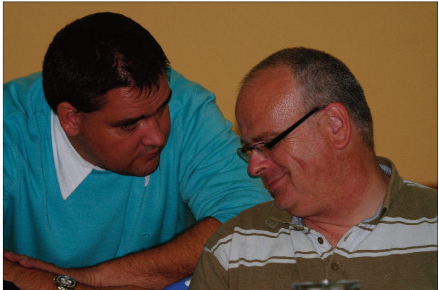
Die Herausgeber Bernd (links) und Michael (rechts) beim intensiven Gedankenaustausch am Rande der CTIF Tagung 2010 in Varazdin (Kroatien)

Wir sind voller Tatendrang, wollen noch viele Ausgaben der Feuerwehrchronik folgen lassen. Nur gemeinsam sind wir stark und hoffen auf eure Hilfe bei der Mitgestaltung der Zeitschrift. Bei dieser Gelegenheit möchten wir uns bei allen Unterstützern, Autoren und dem Redaktionsteam bedanken. Das Layout haben wir auch etwas verändert, wollt es noch ansprechender gestalten. Zu unserem Jubiläum wollen wir einige Stimmen zu Wort kommen lassen.