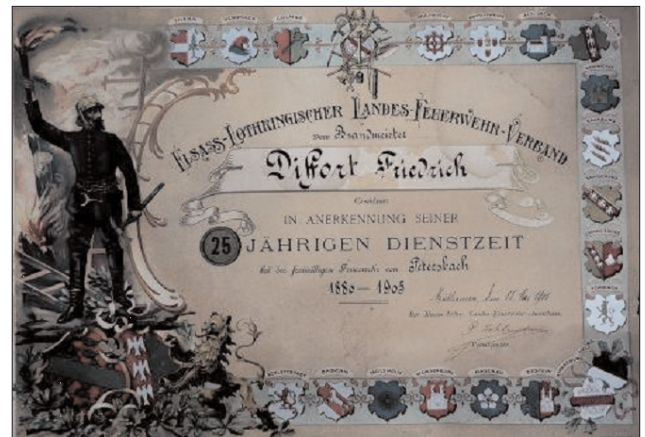
Ehrendiplom für 25-jährige Dienstzeit in der Feuerwehr (1. Ausführung bis 1910)

Der Landesfeuerwehrverband gab an die Mitglieder seiner Verbandsfeuerwehren Ehrendiplome für 15 bzw. 25 Jahre aktive Dienstzeit aus. Die Ehrenurkunde zeigt neben dem Schriftzug mit der Jahreszahl 15 bzw. 25 die Wappen der Kreise des Reichslandes und die von einem Löwen gehaltenen Wappen der Landgrafschaft Oberelsaß und des Herzogtums Lothringen. Ab ca. 1905 wurden die Diplome neben dem Landesverbandsvorsitzenden nun auch vom Branddirektor der betreffenden Feuerwehr unterschrieben. Ab Januar 1911 kamen die Ehrendiplome für 25 Jahre in einem veränderten Aussehen, als die für 15 Jahre, zur Verleihung. Neben dem Schriftzug zieren nun Feuerwehrgeräte und eine Löschszene das Bild, auf dem noch zwei Festdamen huldigen und das Wappen des Reichslandes mit Feuerwehrsymbold krönt. Alte 25-jährige Ehrendiplome konnten gegen eine Gebühr ausgetauscht werden. Feuerwehrleute des Reichslandes wurden auch für ihren Feuerwehrdienst von staatlicher Seite ausgezeichnet. So verlieh S. M. der Deutsche Kaiser an Feuerwehrmänner mehrfach im Jahr das Allgemeine Ehrenzeichen, nur wenige Male im Jahr den Königlichen Kronenorden, IV. Klasse, nur ein Mal in mehreren Jahren das Kreuz zum Allgemeinen Ehrenzeichen oder die Rettungsmedaille am Bande für Menschenrettung und nur an wenige hochverdiente Persönlichkeiten des Feuerlöschwesens den Königlichen Kronenorden, III. Klasse. Doch war auch der Wunsch nach einem eigenen trag-