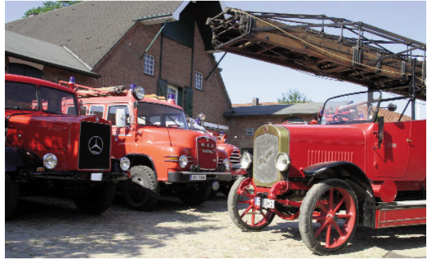
Historische Feuerwehrfahrzeuge auf dem Museumshof

sicht und technischen Betreuung der Feuerwehrfahrzeuge. Der privaten Eigeninitiative des Fördervereins ist es zu verdanken, dass der ehemalige 200 Jahre alte Hof Lüdemann nach denkmalpflegerischen Gesichtspunkten restauriert und an diesem Standort 1990 das Feuerwehrmuseum Schleswig-Holstein eröffnet werden konnte. Die umfangreiche Sammlung von Bolko Hartmann sowie die Exponate des 1988 geschlossenen privaten Feuerwehrmuseums in Neumünster bildeten den Grundstock für die heutige Sammlung des Feuerwehrmuseums Schleswig-Holstein.