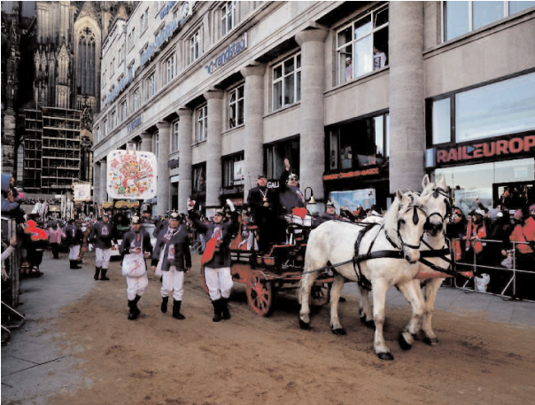
Funketöter bei der Teilnahme am Rosenmontagszug