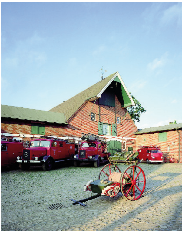
Historische Feuerwehrfahrzeuge auf dem Museumshof

Das Museum wird vom Förderverein Feuerwehrmuseum Hof Lüdemann e.V. getragen und von der Stadt Norderstedt und privaten Sponsoren finanziell unterstützt. Der Förderverein wurde vor 26 Jahren am 22. Januar 1987 von engagierten Bürgern und Förderern sowie von den vier Ortswehren Norderstedts gegründet. Zurzeit hat der Förderverein rund 340 Mitglieder. Viele Bürgerinnen und Bürger helfen dem Museum auch durch ehrenamtliche Tätigkeiten, vor allem im Bereich der Auf-