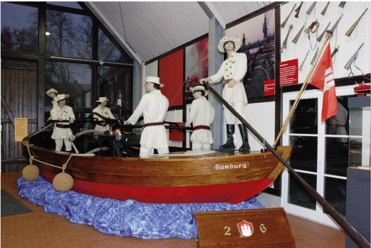
Nachbau einer Schutenspritze, einem Vorgänger der Löschboote in Hamburg

die Rettung einer Kuh aus dem Moor dargestellt. Einen Überblick über die Bedeutung des Feuers für die Entwicklung der Menschheit, gibt die 2012 neu eröffnete Abteilung zur Kulturgeschichte des Feuers. Die Bibliothek des Feuerwehrmuseums, die ehrenamtlich betreut wird, umfasst fast 6.000 Publikationen und ist ein Blickfang im Uniformenraum.