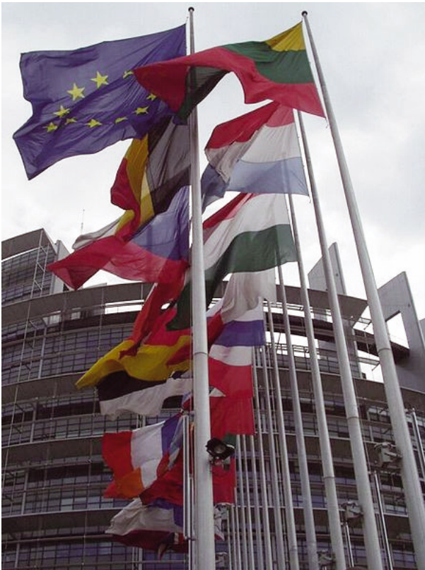
Flaggen vor dem Europaparlament in Straßburg

198 Staaten zeigen heute ihre Nationalfarben. „Erblickt ein besonnener Geist die Flagge einer Nation, sieht er nicht nur die Flagge selbst, sondern auch die Nation dahinter – welcher Art ihre Symbole und Insignien auch sein mögen, sieht er in ihr vorrangig ein Sinnbild für die Regierung, die Prinzipien, die Wahrheiten und für die Geschichte dieser Nation“, schrieb der Amerikaner Henry Ward Beecher vor 130 Jahren.