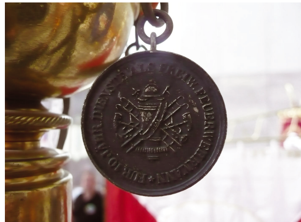
Bild 15: Medaillen für 10jährigen Dienst als Freiwilliger Feuerwehrmann

Als letzte der Medaillen wird eine Auszeichnung für 10jährige Dienste als Freiwilliger Feuerwehrmann beschrieben.