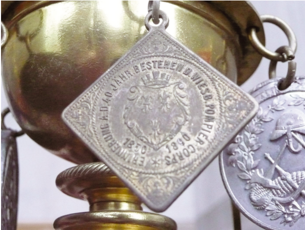
Bild 12: Medaille zur Erinnerung an das 40jährige Bestehen des Wiesbadener Pompiers Corps 1850 - 1890

Medaille zur Erinnerung an das 40jährige Bestehen des Wiesbadener Pompiers Corps 1850 – 1890. Bei dieser Medaille handelt es sich sicherlich um eine Auszeichnung die bei einer Jubiläumsfeier, welche in Wiesbaden stattgefunden haben muss, verliehen wurde.