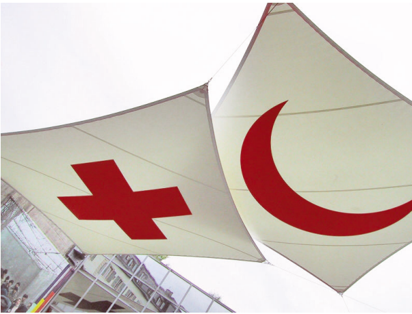
Die Logos der Internationalen Rotkreuz- und Rothalmond-Bewegung am Eingang des Internationalen Rotkreuz- und Rothalmondmuseums in Genf

Flaggen erzählen Geschichte: viele tragen das christliche Kreuz, den islamischen Halbmond