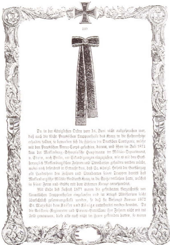
Bild 2: Abbildung einer Fahnen­schleife mit dem Eisernen Kreuz wie es nach der Erneuerung 1870 / 1871 verliehen wurde. Aus: Louis Schneider, Buch zum Eisernen Kreuz, Seite 140

durch das Eiserner Kreuz für den Feldzug 1870/71 erfolgte auch die Wiederbelebung der Auszeichnung an die Fahne. Damit verbunden waren auch einige Änderungen welche sich hier wiederum am besten aus dem Text des Buches von Louis Schneider entnehmen lassen. So schreibt er auf der Seite 138 und 139 folgendes: