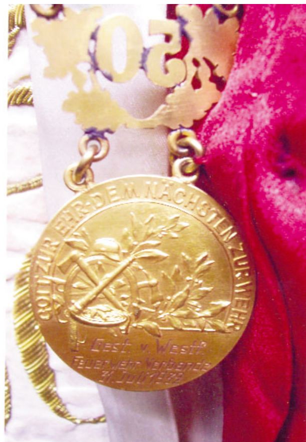
Bilder 4 bis 6: Abbildung der Feuerwehrfahne der Abteilung II mit den Detailbildern der Auszeichnung

Als Anmerkung sei erwähnt das alle Feuerwehrfahnen in dem Jubiläumsbuch der Bielefelder Feuerwehr „Alarm 150 Jahre Wettlauf