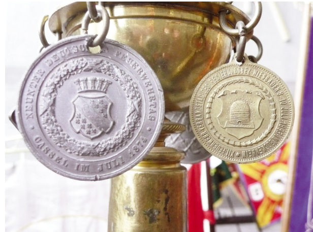
Bild 14: Medaille zum neunten Deutschen Feuerwehrtag, Cassel im Juli 1874

Eine weitere Medaille anlässlich des neunten Deutschen Feuerwehrtages, Cassel im Juli 1874 gibt wiederum weitere Fragen auf. Wurde diese Medaille an die Fahnen ausgegeben, welche an dem Feuerwehrtag mitgeführt worden sind? Oder konnten diese Medaillen als Festtagsabzeichen käuflich erworben werden? Kann man diese Medaillen als Vorläufer von