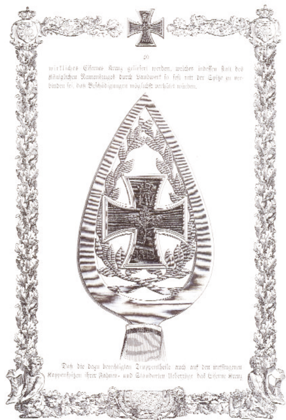
Bild 1: Abbildung einer Fahnen Spitze mit dem integrierten Eisernen Kreuz von 1813. Aus: Louis Schneider, Buch zum Eisernen Kreuz, Seite 40

Aus Autorensicht sind hier schon zwei interessante Aspekte zu werten. Zum einen wird die Fahne selbst als Auszeichnung gewertet. Sicherlich ein Punkt der heute nicht mehr allen Personen in Deutschland bekannt sein dürfte. Zum anderen wird die Stiftung einer Auszeichnung, nämlich dem Eisernen Kreuz, durch den allerhöchsten Befehl des Königs selber vollzogen. Eine entsprechende Abbildung einer Fahnen Spitze ist ebenfalls aus dem Buch von Louis Schneider entnommen worden.