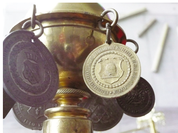
Bild 11: Medaille für den XII. Feuerwehr Verbandstag des Regierungsbezirk Wiesbaden 8-10 Juli 1893 in Bockheim

ihren Chroniken über die Verbandstage und