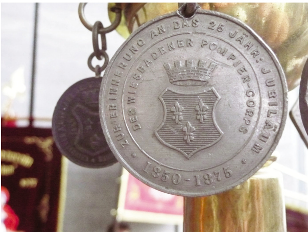
Bild 13: Medaille zur Erinnerung an das 25jährige Jubiläum des Wiesbadener Pompiers Corps 1850-1875

Das bei Jubiläen Feuerwehren-Medaillen als Erinnerung ausgegeben worden sind, ist durchaus bekannt und nicht einmal sehr selten. Lediglich die Befestigung an einer Feuerwehrfahne war dem Verfasser so nicht bekannt. Dies gilt gleichermaßen für die Medaille „Zur Erinnerung an das 25jährige Jubiläum des Wiesbadener Pompiers Corps 1850-1875“.